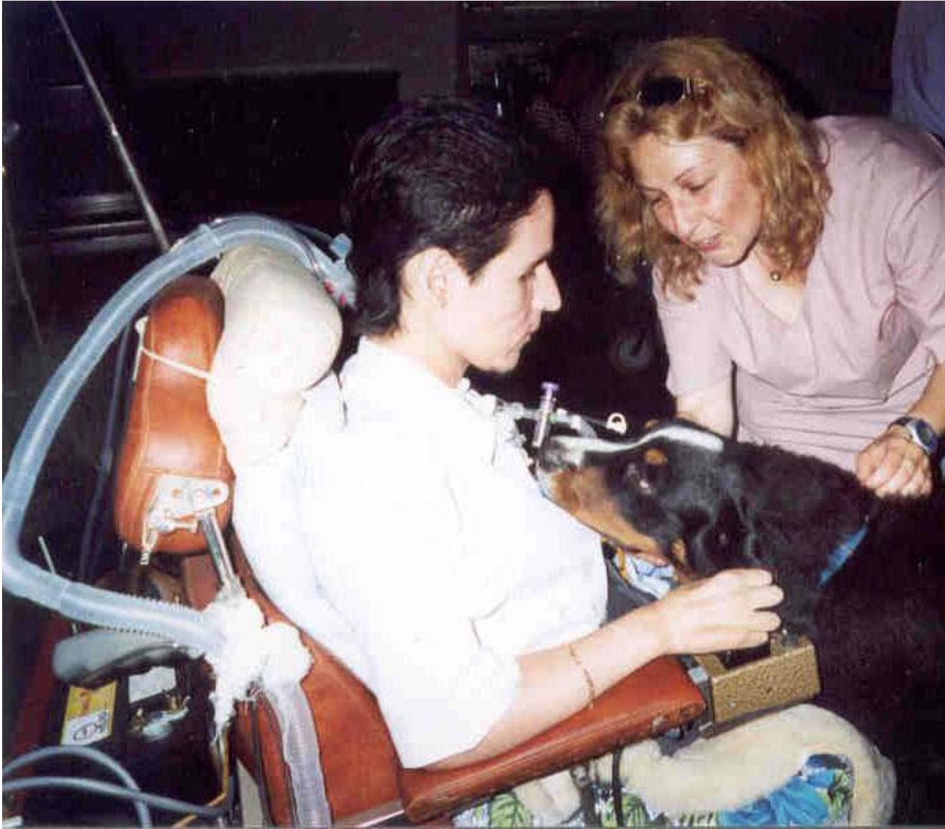
Trabajo con pacientes terminales en hospitales